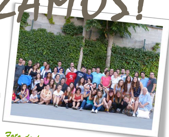
Foto de familia de la Asamblea del Movimiento Calasanz

En este número queremos contarte cómo va la cosa, qué proyectos, viejos y nuevos, nos traeremos este curso entre manos, que novedades nos vamos a encontrar,...