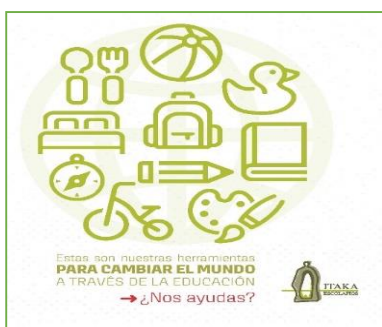
Materiale per la campagna dei partner.