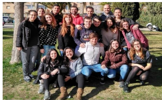
Incontro a febbraio dei giovani di “Esci della tua terra”.

Dopo la chiamata fatta in questo ciclo, con il nome di “Esci dalla tua terra”, tredici giovani hanno iniziato il percorso di due anni, il quale include la permanenza di un mese come volontario nelle zone più emarginate e povere. Quest'anno, i giovani partecipanti saranno accolti nelle aree scolapie di Anzaldo (Bolivia), Atambúa (Indonesia), Campeche (Messico) e Quito (Ecuador).