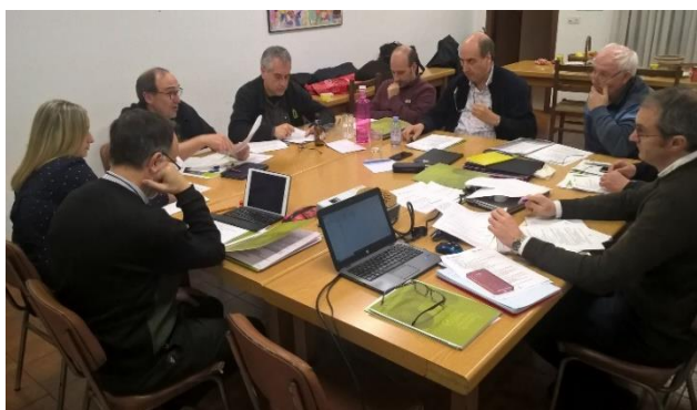
Membri del Consiglio, insieme al Generale, durante l'incontro.

La campagna attuale prosegue nella direzione indicata dalle campagne dei due anni precedenti -dirette a Indonesia e India-, e come queste, avrà certamente un grande successo per quanto riguarda la raccolta di fondi, la partecipazione e l'azione di sensibilizzazione (53 centri educativi coinvolti lo scorso anno).