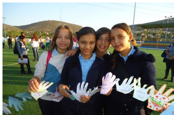
Settimana per la Pace a Barquisimeto (Venezuela).

Le iniziative sono state differenti, in accordo con la realtà del luogo e la natura del progetto: atti pubblici di sensibilizzazione e mobilitazione sociale, attività nelle aule, nei progetti di educazione non formale, nei gruppi del Movimento Calasanz... Con tutte queste attività, da Itaka-Escolapios vogliamo dare il nostro contributo a un valore fondamentale e un pilastro dell'educazione, costruendo la pace a partire dalla nostra realtà quotidiana.