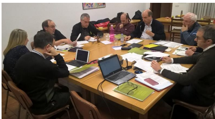
Membros do Patronato, juntamente com o Pe. Geral, durante a reunião.