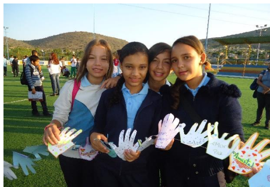
Semana pela Paz em Barquisimeto (Venezuela).

As iniciativas foram diversas, muito diversas, dependendo da realidade de cada lugar e dos projetos: eventos públicos de conscientização e mobilização social, atividades nas salas de aula, nos projetos de educação não formal, nos grupos do Movimento Calasanz... Com isso, queremos continuar contribuindo a partir da Itaka-Escolápios para um valor fundamental e um eixo educacional, como a construção da paz em nosso ambiente mais próximo e no mundo.