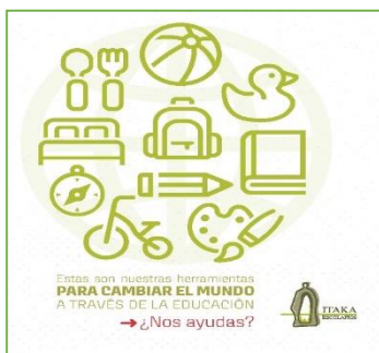
Materiais da campanha de sócios