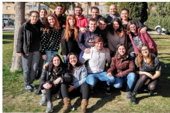
Encontro de jovens do “Saia da sua terra” em fevereiro.

Após a convocação deste período, já lançada com o nome “Saia da sua terra”, treze jovens iniciaram este itinerário de dois anos, que inclui uma estadia voluntária de um mês com os mais desfavorecidos. Este ano serão as presenças escolápias de Anzaldo (Bolívia), Atambúa (Indonésia), Campeche (México) e Quito (Equador) que receberão os jovens participantes.