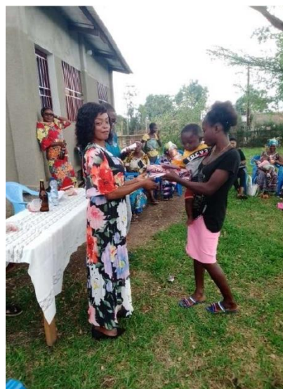
Figuras 3 y 4: Grupo de corte y confección, curso 2023-2024.