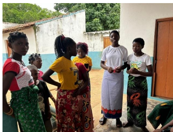
Figuras 5 y 6: Grupos de Mozambique y Camerún, curso 2023-2024.