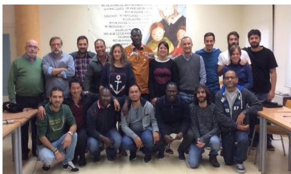
Participantes en la jornada de Madrid