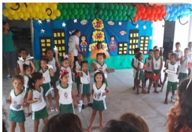
Actividades infantiles en el centro social de Coquerão

Las Escuelas Pías de Brasil y Bolivia viven actualmente un momento de crecimiento de la misión en ambos países, con nuevas obras y retos de los que participa Itaka-Escolapios: en Brasil iniciamos presencia en Aracajú (estado Sergipe, nordeste del país), en el barrio de Coquerão, lugar con muchas carencias donde se asume la parroquia y el centro social vinculado a ella. Y por otro lado, son dos los pasos a destacar: la nueva presencia en Santa Cruz, ciudad en la que se recibe una parroquia y un gran colegio en el popular barrio La Cuchilla. Junto a ello, la puesta en marcha de dos nuevos espacios de residencia universitaria en Cochabamba, a fin de afrontar con nuevo impulso el problema recurrente que tienen los chicos y chicas de Anzaldo y Cocapata para seguir estudios universitarios.