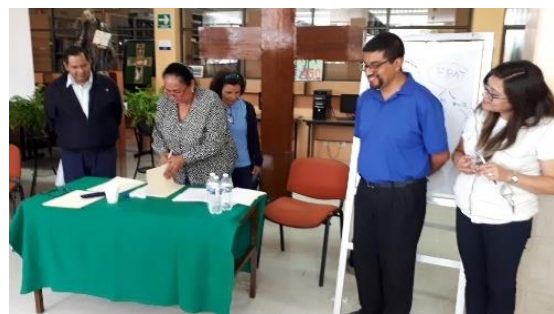
Acto de adhesión de la Fraternidad de México a la red

Itaka-Escolapios México está viviendo en los últimos meses momentos especiales de ilusión y novedad. En septiembre, la Fraternidad escolapia de México se adhería a la carta programática de Itaka-Escolapios, incorporándose así oficialmente a la Red. Por otra parte, también desde este curso, han pasado a integrarse dentro de Itaka-Escolapios tanto el Movimiento Calasanz como la promoción y acompañamiento del voluntariado escolapio en todo el país. Se trata de dos ámbitos muy importantes de la misión escolapia en México, en los que se van dando pasos significativos y que se suman a la apuesta por crecer y compartir en red.