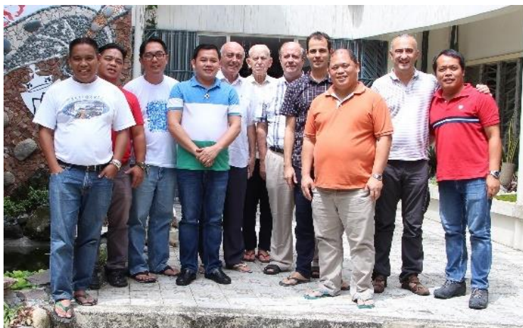
Reunión final en Manila con los responsables de Itaka-Escolapios en Filipinas