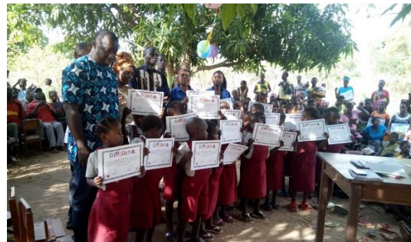
Actividad de final de curso en noviembre, con los niños y niñas de la escolinha

Desde fechas recientes contamos con un nuevo país en la red Itaka-Escolapios: Mozambique. Se trata de una nueva fundación de las Escuelas Pías, presentes allí desde hace escasos dos años. La presencia escolapia está en la zona de Pemba, en el norte del país. De momento la misión escolapia se centra en la parroquia de São Luiz Maria Grignon de Monfort (muy extensa, con hasta 30 capillas algunas muy distantes), así como la “ escolinha ” (escuela infantil) Beata Maria da Paixão, que atiende a niños y niñas de hasta 5 años. El compromiso es apoyar desde Itaka-Escolapios estas dos obras y acompañar el gran desarrollo que puede tener la presencia escolapia en Mozambique.