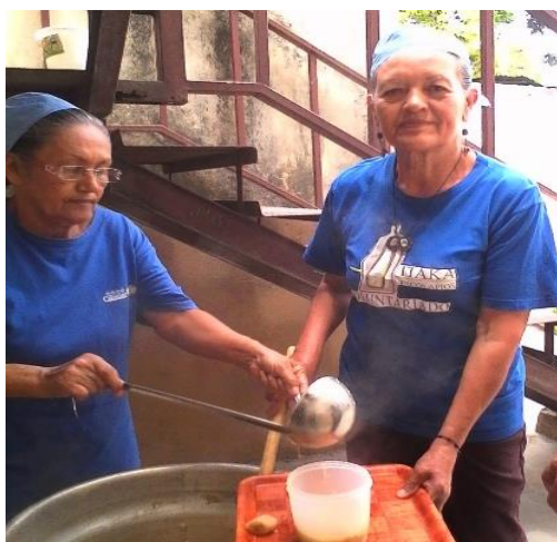
Apoyo alimentario de Itaka-Escolapios Venezuela